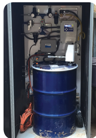
Дополнительный корпус бочкового насоса

Защита дорогостоящих узлов щековой дробилки от экстремальных условий работы имеет важное значение для ее эффективности. Автоматическая система смазки является главным условием продления срока службы критически важных компонентов, позволяя снизить затраты на их обслуживание. Благодаря непревзойденной точности подачи смазки наши системы увеличивают производительность и время безотказной работы. Доступны дополнительные корпуса для установки «подключай и работай», а также автономная конструкция, которую можно легко модернизировать.